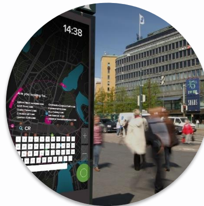
INTELIGENTNI INFO KIOSCI