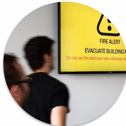
ALARMNE INFORMACIJE I HITNE SITUACIJE