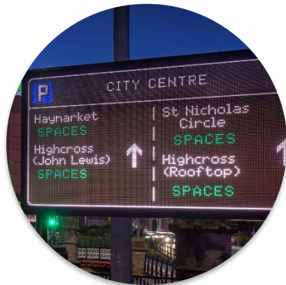
PAMETNO UPRAVLJANJE SAOBRAĆAJEM